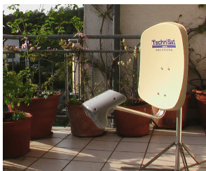
Kleine transportable Satellitenantenne mit nur etwa 45 cm Schirmgröße von TechniSat.